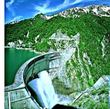
黒部ダム (4月下旬～11月下旬)

高さ186m、堤長492mを誇る日本最大のアーチ式ドーム型ダム 展望台から見る放水時の虹の美しさは感動的