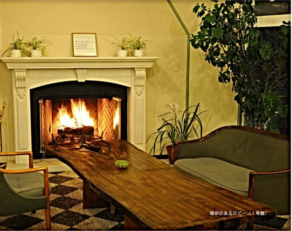
暖炉のあるロビー (1号館)