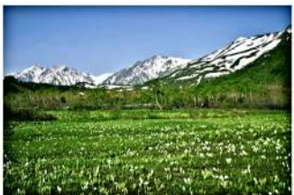
柵池自然園(水芭蕉湿原)

春は菜の花、夏はラベンダー、秋は白いそばの花が 一面に広がります。(ホテルから車で20分)