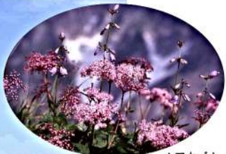
▲アカバナ シモツケソウ

雄大な自馬山麓に抱かれた、 ホテルパイプのけむり。 四季折々、大自然が織りなす景色とウインタースポーツを 存分に楽しめる宿として、お気軽にご利用下さい。