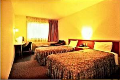
1号館 (ツインルーム)