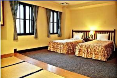
3号館 (和洋室 / 4名様用)

白樺グレンデ前、無料駐車場、更衣室完備、スキー、 スノーボード全面滑走可。(ホテルから徒歩1分)