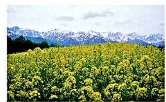
白馬夢農場ふ〜みんなの里

春は菜の花、夏はラベンダー、秋は白いそばの花が 一面に広がります。(ホテルから車で20分)