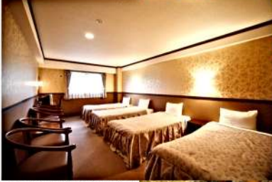
2号館 (洋室 / 4名様用)