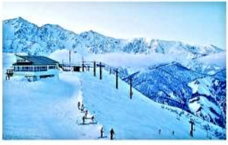
人気NO.1八方尾根スキー場

八方池までのトレッキングコースでは、初夏から 秋にかけて美しい景色が楽しめます。 (ゴンドラ駅まで徒歩5分) 第1ケレンより1時間半のトレッキングで八方池へ。