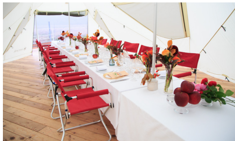
レストランテにてウェルカムパーティー WELCOME PARTY ON THE MOUNTAIN