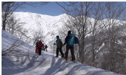
スノーシューツアーで特別な景色の場所へ SNOW SHOE TOUR