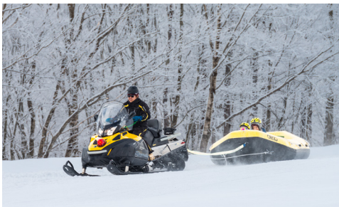
ゲレンデの中を駆け抜けるスノーラフティング SNOW RAFTING