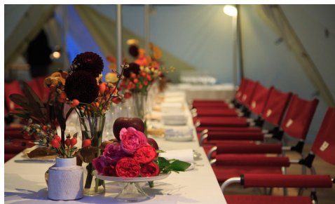
レストランテにてディナー DINNER