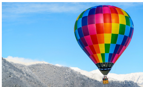
白馬村の景色を一望する熱気球 HOT AIR BALLOON