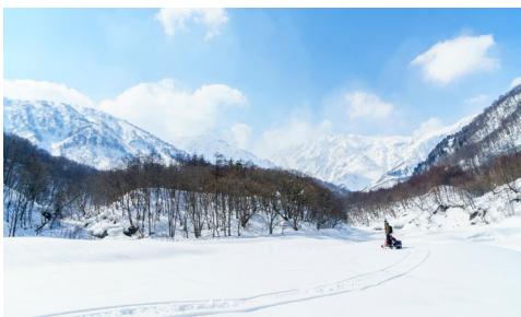
オプション：猿倉スノーモービルツアー OPTION : SARUKURA SNOWMOBILE TOUR