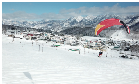
オプション：パラグライダートーイング OPTION : PARAGLIDER TOWING