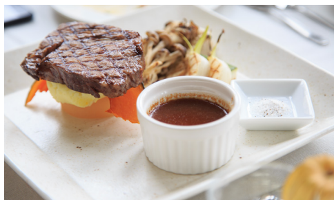
食事は地元シェフが提供するコース PRODUCED BY LOCAL CHEF