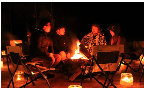
焚火にあたりながらの夜のひととき BURNING FIRE BAR