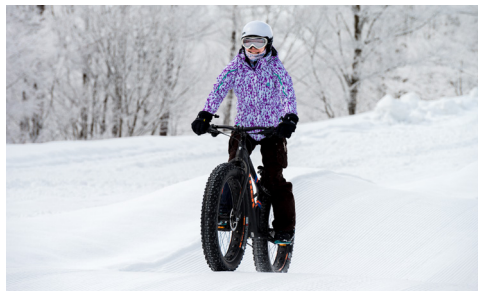
雪上でも安定するファットバイク FATBIKE