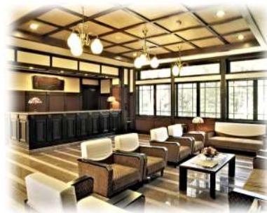
ロビー・フロント