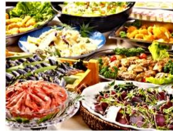
朝・夕食は食べ放題のバイキング