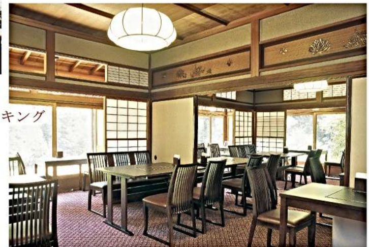
朝食・夕食はバイキング