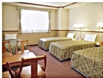
客室（フォース／4人用）